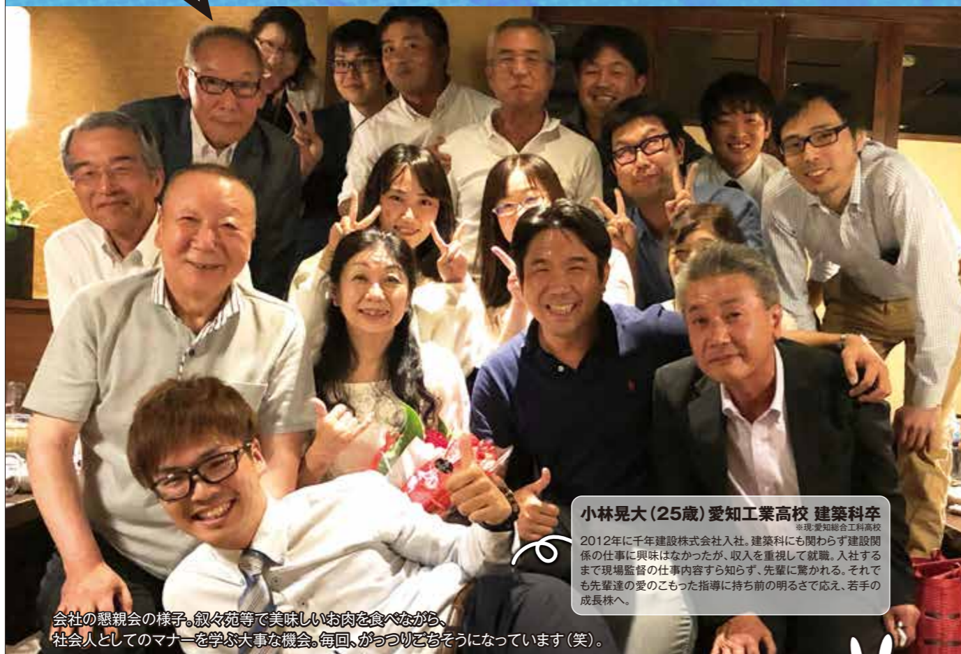
会社の懇親会の様子。叙々苑等で美味しいお肉を食べながら、 社会人としてのマナーを学ぶ大事な機会。毎回、がっつり遊ぶようになっていきます(笑)。

正直、「現場監督」という言葉さえ知らなかったけど、 働くからには稼いで、毎日充実！ その一心で建設業界に飛び込んだ。